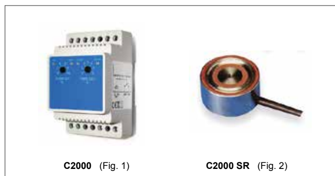
C2000 (Fig. 1)