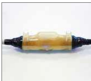
4.- Polimerización Dejar en reposo durante aproximadamente 10 minutos para alcanzar la polimerización adecuada del compuesto.