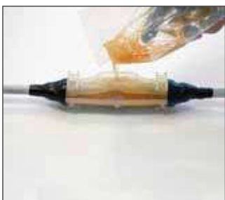
3.- Rellenar torpedo Verter el contenido del compuesto sellante hasta cubrir por completo la entrada del torpedo.