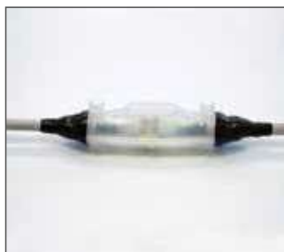
1.- Conexionar y cerrar carcasa