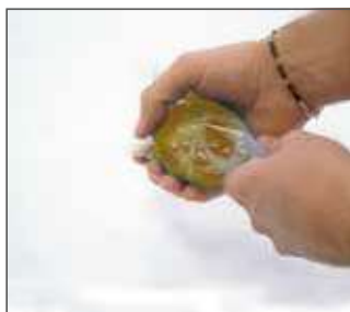
2.- Mezclar componentes Retirar barrera entre los componentes y mezclar 1 min. convenientemente hasta lograr un color homogéneo de la misma.